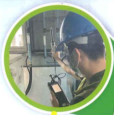
設備機房溫度檢測