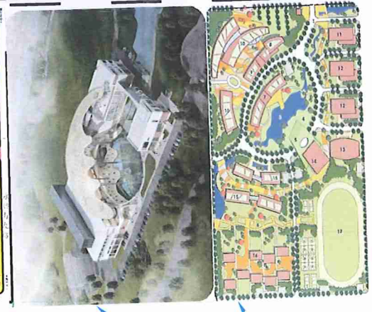
布袋戲傳習中心 國立虎尾科技大學高鐵路校區