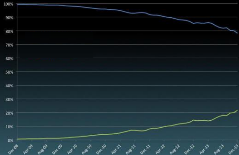
全球互联网流量 (桌面 Vs. 移动)