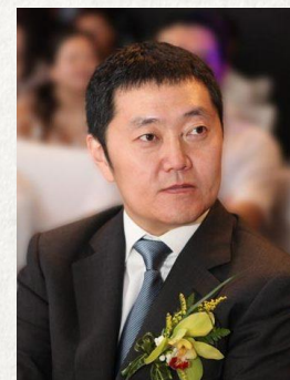
左暉 鏈家控股 董事長