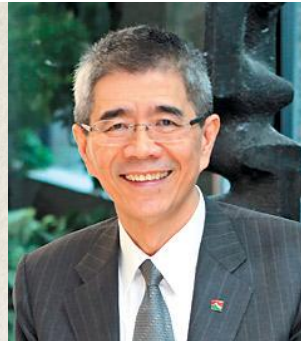
周俊吉 信義房屋 董事長 (邀請中)